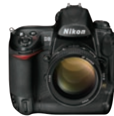
デジタル一眼レフカメラ「D3」