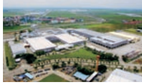
Nikon (Thailand) Co., Ltd.