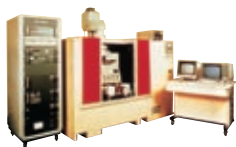
縮小投影型露光装置「NSR-1010G」