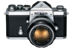
一眼レフカメラ「ニコンF」