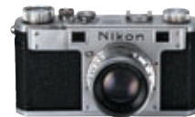
小型カメラ「ニコンI」