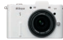
レンズ交換式アドバンスカメラ 「Nikon 1 V1」